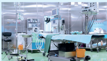
Afdichten van OK-ruimten, medische onderzoeks- en laboratoriumruimten