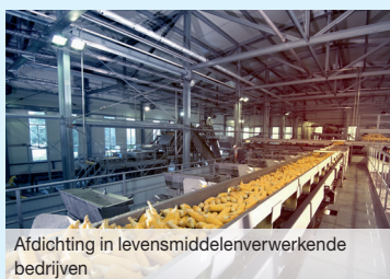
Afdichting in levensmiddelenverwerkende bedrijven