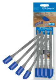
OTTO Fugenfux® 4er-Set voor sanitair- en vloervoegen