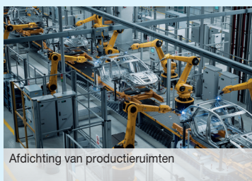
Afdichting van productieruimten