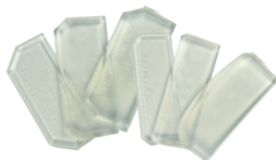
OTTO Fugenboy groot/klein