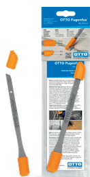
OTTO Fugenfux® Multitool