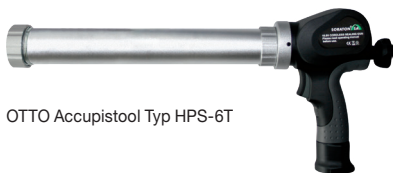
OTTO Accupistool Typ HPS-6T