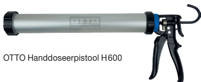
OTTO Handdoseerpistool H600