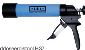
OTTO Handdoseerpistool H37