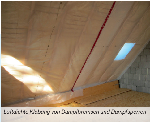
Luftdichte Klebung von Dampfbremsen und Dampfsperren