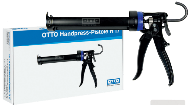
OTTO Handpress-Pistole H 17