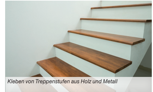
Kleben von Treppenstufen aus Holz und Metall