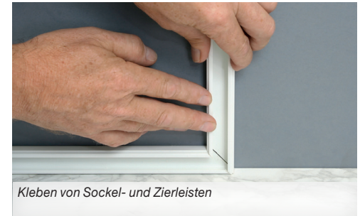
Kleben von Sockel- und Zierleisten